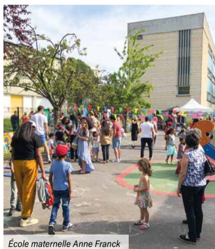
École maternelle Anne Franck

Les élèves de maternelle et d'élémentaire des écoles de Domont se sont retrouvés en cette fin d'année scolaire, pour leurs traditionnelles kermesses, organisées avec le concours de parents bénévoles. À quelques jours des grandes vacances, parents, grands-parents et amis sont venus en nombre profiter des jeux, dégustations et attractions.