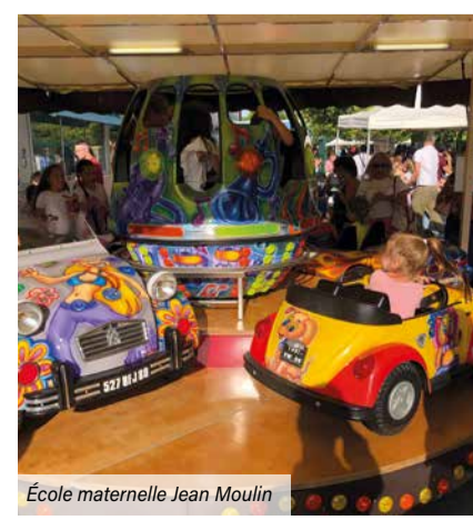
École maternelle Jean Moulin