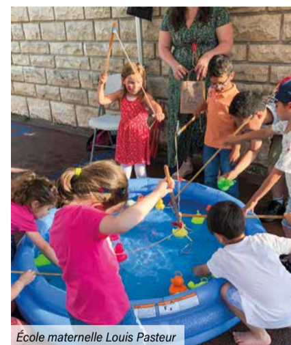
École maternelle Louis Pasteur