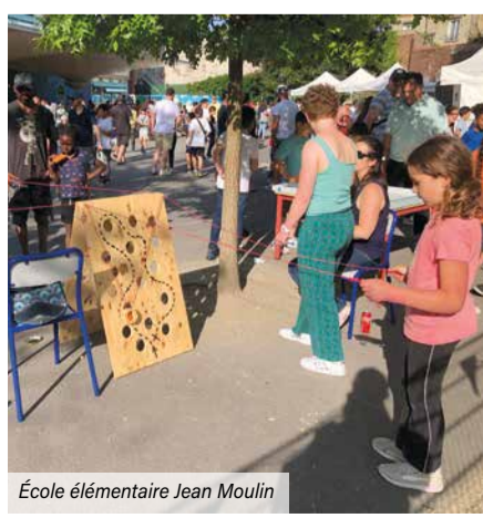
École élémentaire Jean Moulin